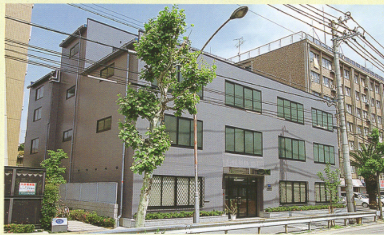
▲本社・堺営業所の外観です。

当社は、日野・いすゞ・ふそう・UDなどのトラック・バス部品を主軸に、乗用車・軽自動車などあらゆる自動車の部品・用品の卸売・小売業として、現在、5営業所・5出張所の計10拠点におよぶネットワークを確立し、事業展開をしております。 絆を大切に、お客さまのご要望にお応えするため、「ご提案」をキーワードに、なお一層信頼を深め「なくてはならない企業」を追求していきます。