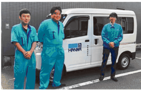
▲ 営業所社員と営業車

当社は、いすゞ・日野・ふそう・UDなどのトラック・バス部品を主軸に、乗用車・軽自動車などあらゆる自動車の部品・用品の卸売・小売業として、現在、5営業所・5出張所の計10拠点におよぶネットワークを確立し、事業展開しております。 絆を大切にし、お客さまのご要望にお応えするため、「ご提案」をキーワードに、なご一層信頼を深め「なくてはならない企業」を追求していきます。